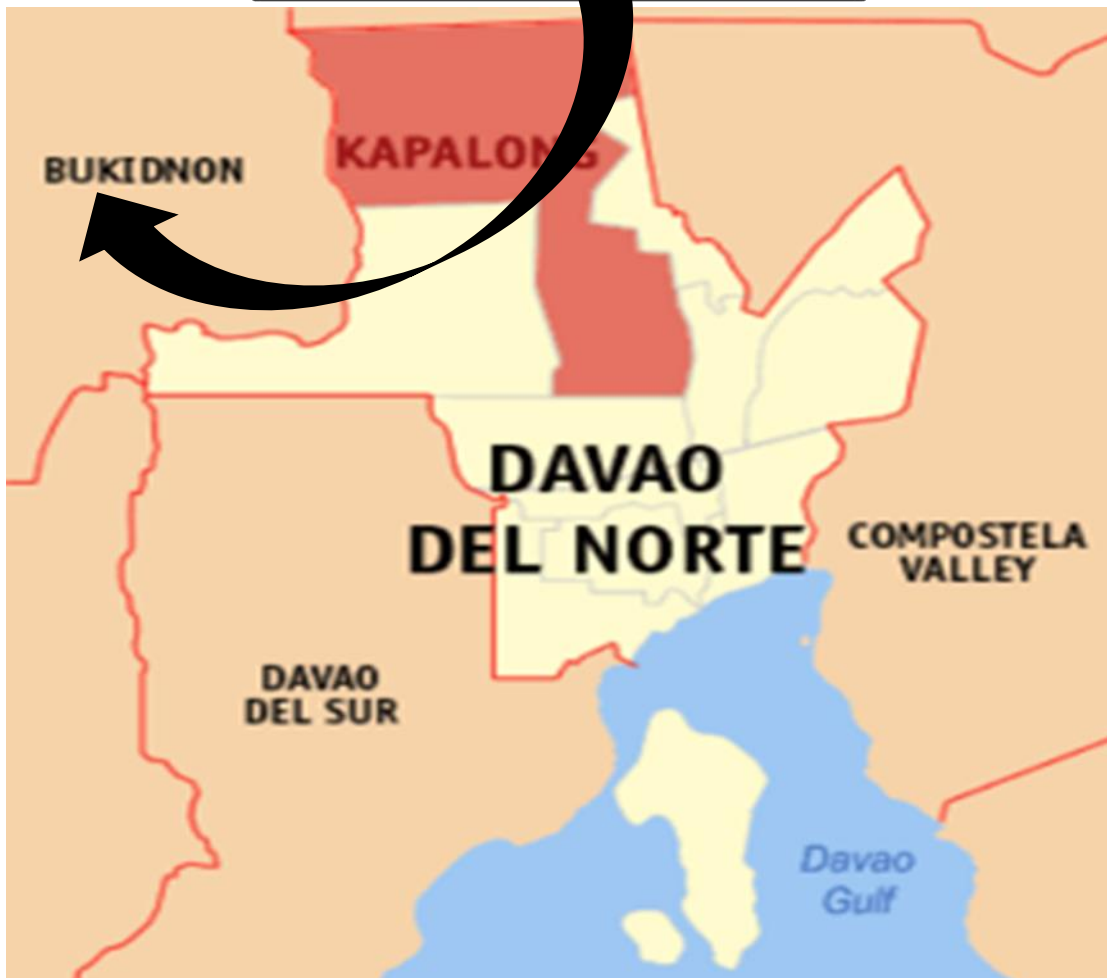
Talaguhitan 2. Mapa ng Rehiyon na ipinapakita ang Lokal ng Pananaliksik